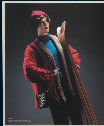
Fotografie z katalogu 'Sportovní oděvy' z roku 1930. Ukazuje módní oblečení.