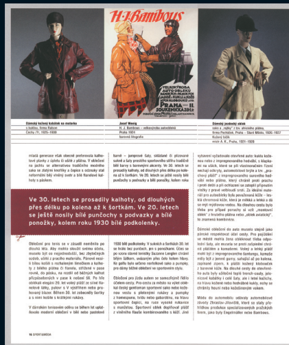
Obrazová stránka z katalogu 'H-13 Bombours' z roku 1930. Ukazuje módní oblečení a doplňky.

E.U.: Hlavním podnětem našich výstav jsou vždy sbírky UPM v Praze, které jsou natolik bohaté, že každá jednotlivá sbírka by vystačila na vlastní specializované muzeum. S Obecním domem spolupracujeme dlouhá léta. Iniciativa k uspořádání výstavy oděvů vzešla od pracovníků výstavního oddělení. Na jejich žádost jsme nabídli několik alternativ, ze kterých si Obecní dům vybral právě výstavu sportovních oděvů. Nás to potěšilo, protože je to téma s velkou vypovídací hodnotou, nejen o samotném vývoji sportovního oděvu, ale i o jeho přínosu k formování moderního účelného a pohodlného oděvu, o životním stylu a společenských souvislostech v různých etapách vývoje české společnosti.