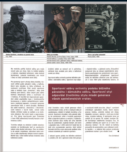
Obrazová stránka z katalogu 'Sportovní oděvy' z roku 1930. Ukazuje sportovní oblečení.